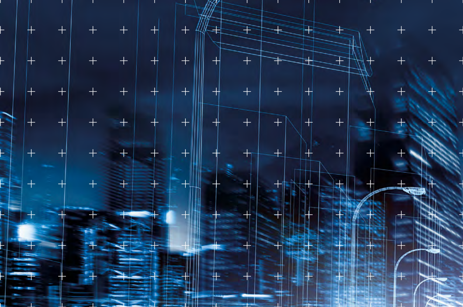
Een uitgave van Bouwend Nederland, oktober 2017